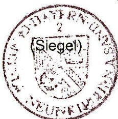
Jens Fankhänel 1. Bürgermeister